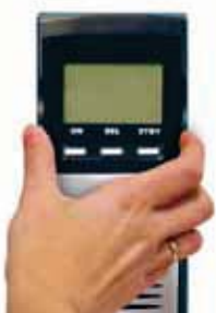
1. Die Anzeigeeinheit herausnehmen