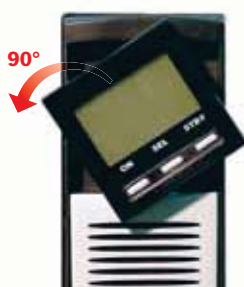
2. Die Anzeige drehen und in ihren Sitz einfügen