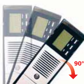
3. Die USV um 90° drehen